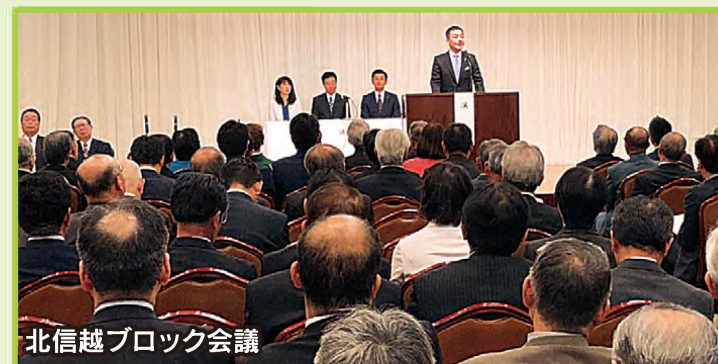
北信越ブロック会議

青年局の活動は局長就任直後から多忙を極めています。全国で活躍する、国を思い、ふるさとを愛する青年たちは未来を拓く原動力です。