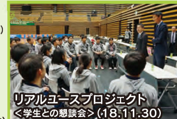
リアルユースプロジェクト<学生との懇談会>(18.11.30)