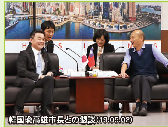
韓国瑜高雄市長との懇談(19.05.02)