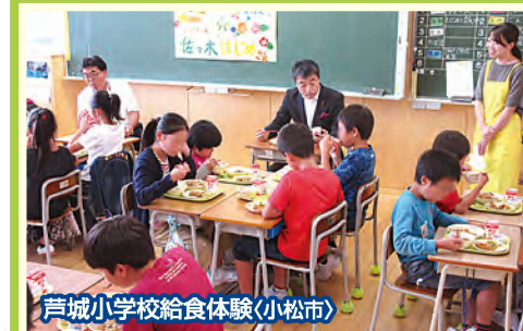
芦城小学校給食体験(小松市)

自民党青年局は国民に一番近い存在で、地方の声にも真剣に耳を傾ける姿勢を貫いてまいります。どうぞ皆様のご支援を心よりお願い申し上げます。