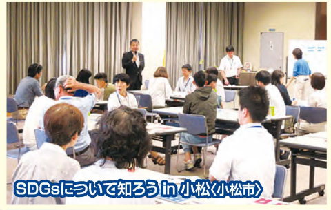
SDGsについて知ろうin小松(小松市)