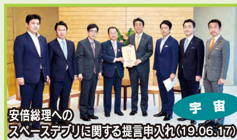
安倍総理へのスペーステクノロジーに関する提言申入れ(19.06.17)

とどまることのない科学の進歩と、社会構造の変化に即して新たに講じなければならない対策は、広い分野で少なくありません。