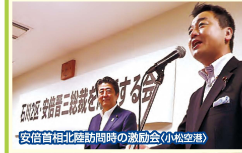
安倍首相北陸訪問時の激励会(小松空港)