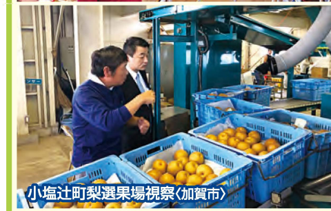
小塩辻町梨選果場視察(加賀市)