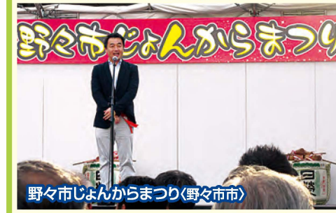
野々市じよんからまつり(野々市市)