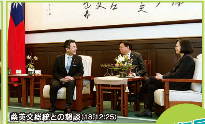
蔡英文総統との懇談(18.12.25)

自民党における台湾交流の窓口となっている青年局。例年以上に訪台の機会を増やし、日台並びに極東アジアの更なる発展に向けて積極的な意見交換をしました。