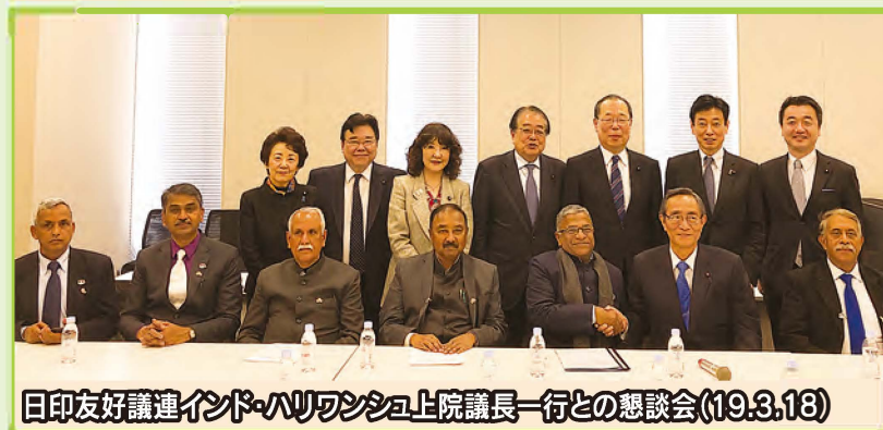
日印友好議連インド・ハリヤナラ州上院議長一行との懇談会(19.3.18)

ウズベキスタン、タジキスタン、インド、リトアニア、サウジアラビアなど多数の国々との議連活動を進めている。