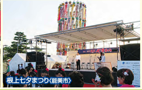
根上七夕まつり(能美市)