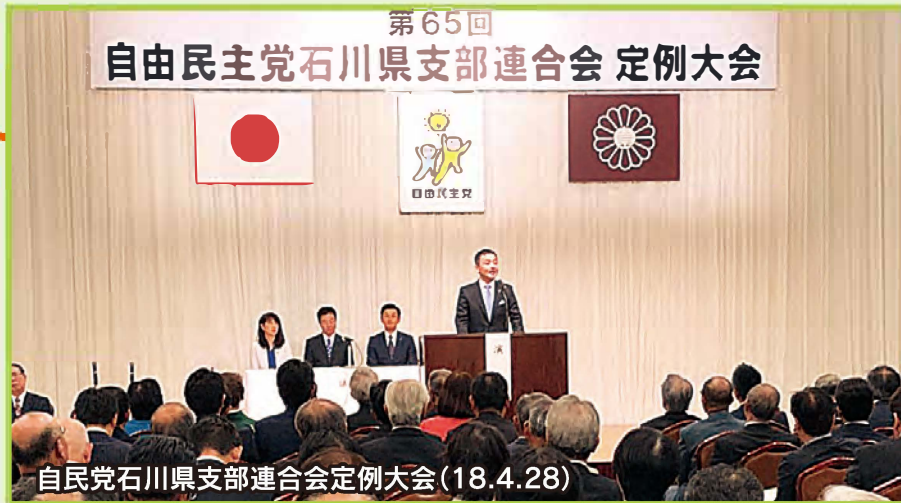
自民党石川県支部連合会定例会(18.4.28)

12年に1度しかない、春の統一地方選挙と夏の参議院選挙が重なるタイミングで自民党石川県連会長に就任しました。若さと行動力を武器に、党勢拡大に向けて頑張ってきました。諸先輩方のご助力のもと、力及ばずな部分もありましたが、一定の成果をあげることができたのではないかと感じております。