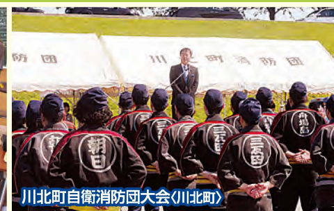
川北町自衛消防団大会(川北町)