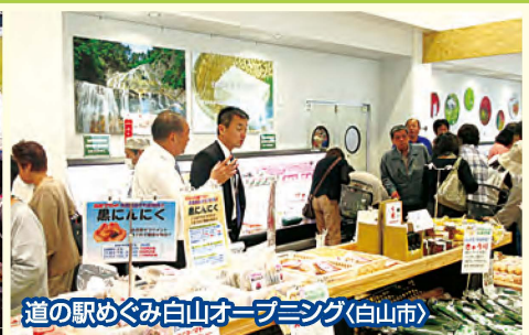
道の駅めぐみ白山オープニング(白山市)