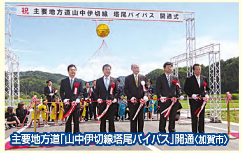
祝 主要地方道「山中伊切線尾尾バイパス」開通(加賀市)