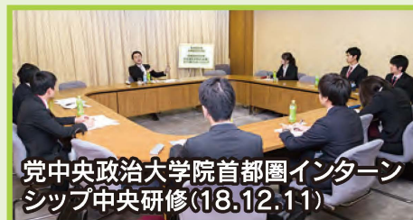
党中央政治大学院首都圏インターンシップ中央研修(18.12.11)

常設機関としては党内最高意思決定機関。党内のほぼ全ての政策・方針はこの場で決定されます。