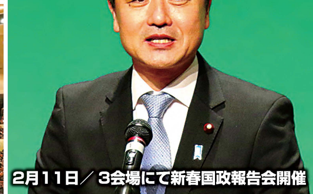
2月11日 / 3会場にて新春国政報告会開催