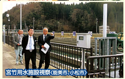
宮竹用水施設視察(能美市・小松市)